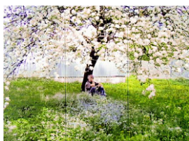
Kolig_Apfelbluete.jpg Cornelius Kolig, Apfelblüte Bildnachweis: © Archiv Cornelius Kolig