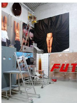
Kolig_Paradies_Sixtina.jpg Das Paradies – Sixtina