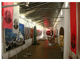
Kolig_Paradies_Saustall.jpg Das Paradies – Saustall