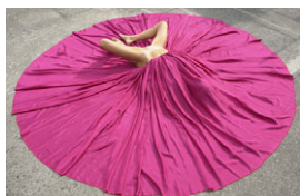
Kolig_Hochzeitskleid.jpg Cornelius Kolig, Hochzeitskleid, 2001

Weiteres frei verwendbares Bildmaterial steht Ihnen nach Aufbau der Ausstellung voraussichtlich ab 20. Jänner 2011 auf unserer Web-Site zur Verfügung.