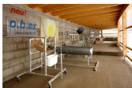
Kolig_Paradies_linkeNiere.jpg Das Paradies – Linke Niere